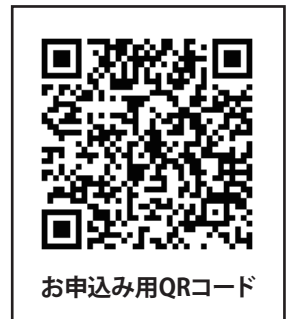
お申込み用QRコード

レンタルスキー代(2,700円)、レンタルウェア代(2,700円)、 レンタル小物品：手袋・ゴーグル・帽子の3点セット(1,500円)